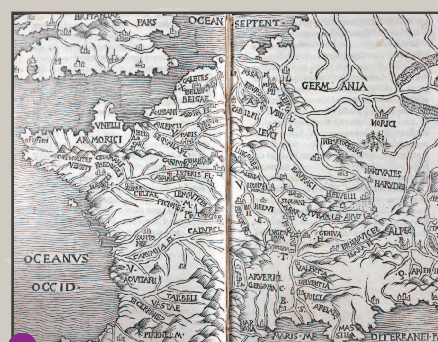
Carte de la Gaule dans les annotations de Glaréan sur César. / Gallienkarte aus Glareans Anmerkungen zu Caesar.

Basel, J. Faber, 1527 [Freiburg, UB, J 4725]