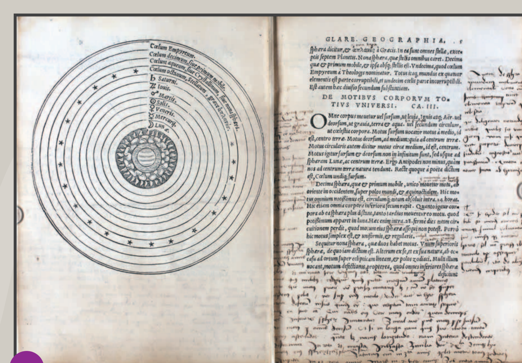
Page double de la Géographie de Glaréan avec une représentation des sphères célestes et de nombreuses annotations manuscrites. / Doppelseite aus Glareans Geographie mit einer Darstellung der Himmelskugeln und reichen handschriftlichen Anmerkungen.

Basel, J. Faber, 1527 [Freiburg, UB, J 4725]