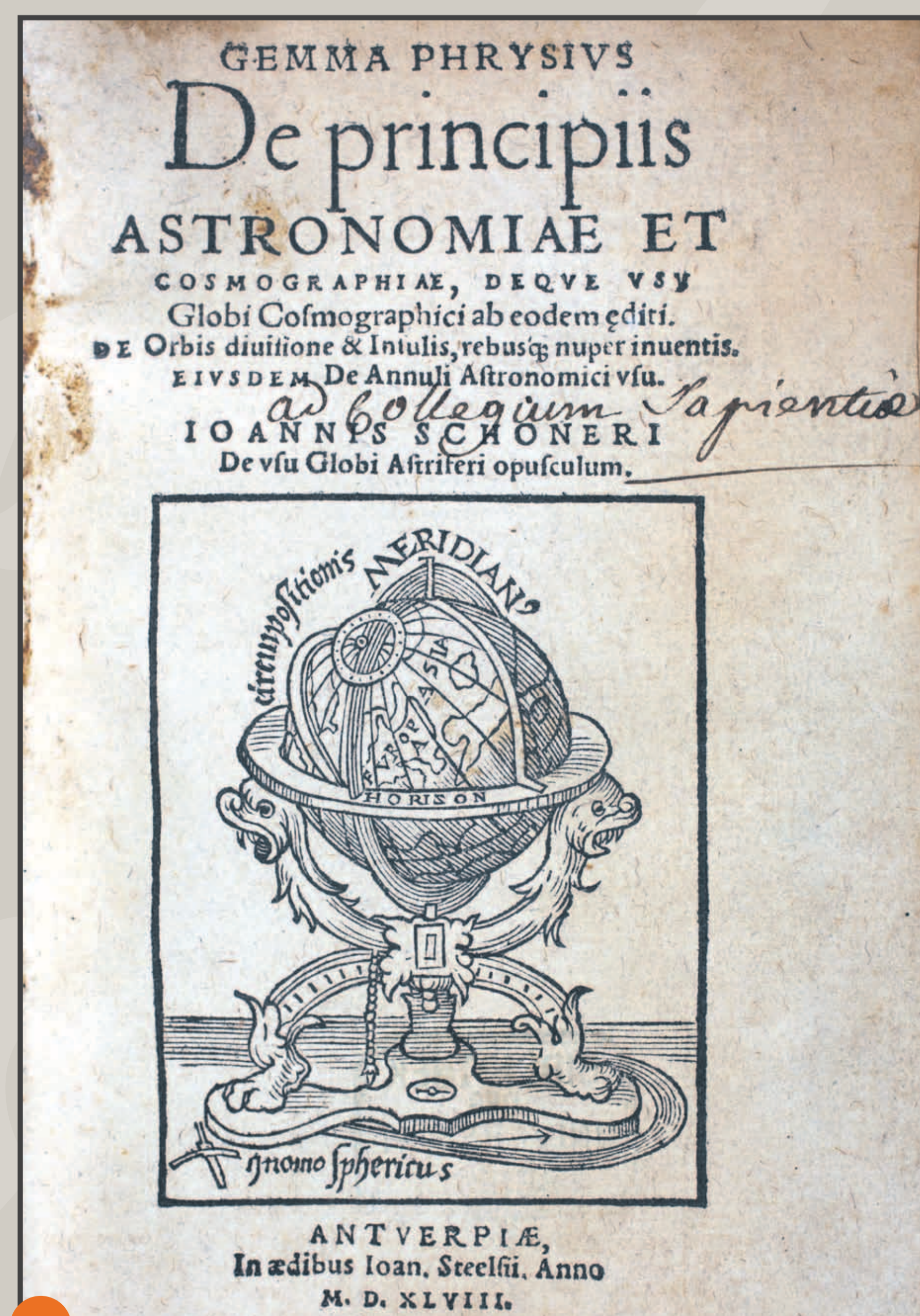
Page de titre du De principiis astronomiae et cosmographiae de Gemma Frisius. / Titelblatt von De principiis astronomiae et cosmographiae des Gemma Frisius.

[Strasbourg], [J. Grüniger], 1516 [Washington, Library of Congress, Map Division, J G 3200 1516. W 3 Vaule]