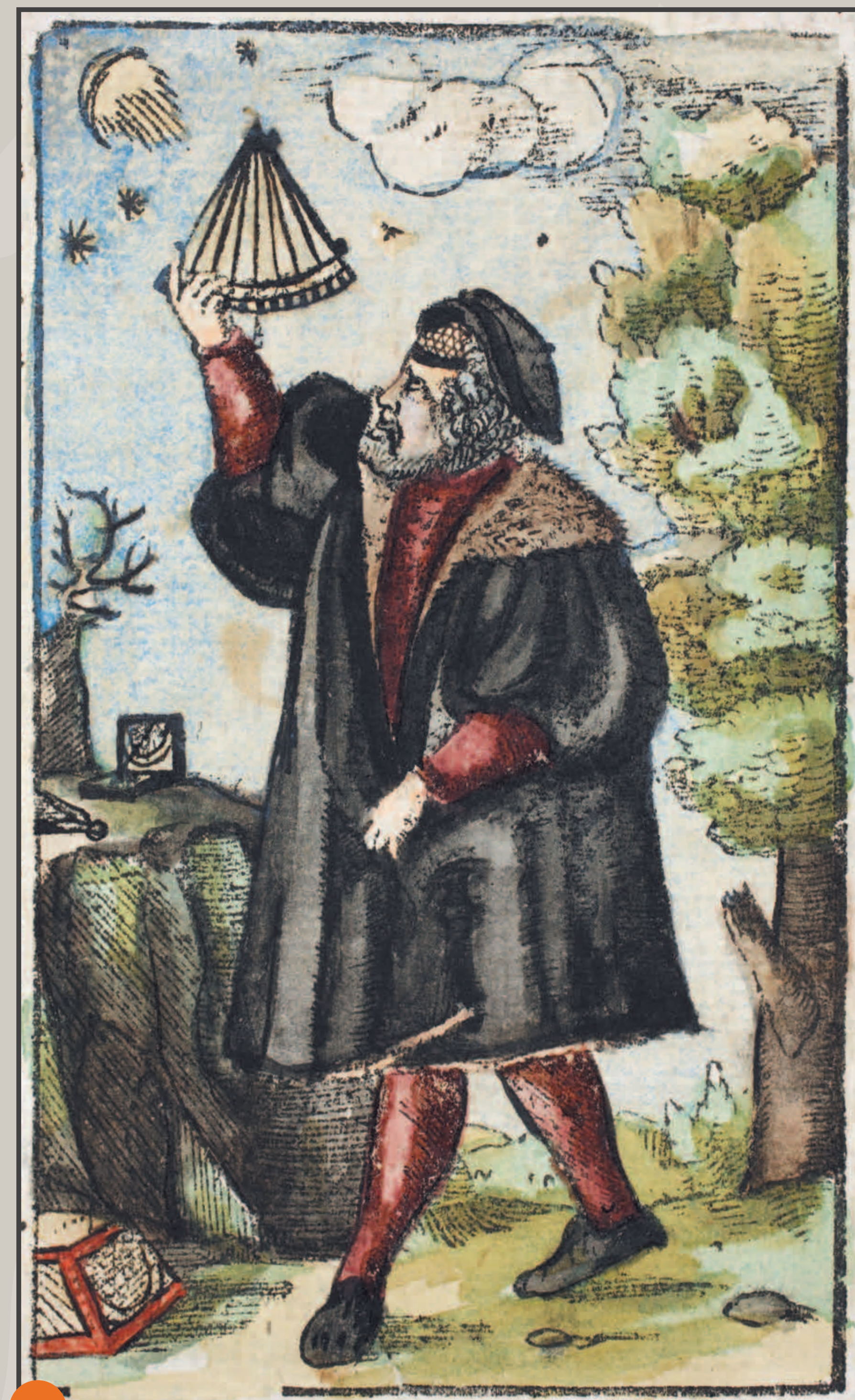
Représentation illustrée d'un cosmographe dans la Cosmographia de Sebastian Münster. / Bildliche Darstellung eines Kosmographen in Sebastian Münsters Cosmographia .

Im Gegensatz zu Apian gelangt der Oberfranke Johann Schöner in seinem 1533 publizierten Opusculum geographicum paradoxerweise ausgerechnet durch die Weltumsegelung Magellans zu der Erkenntnis, daß es sich bei Amerika um einen Teil Asiens handle.