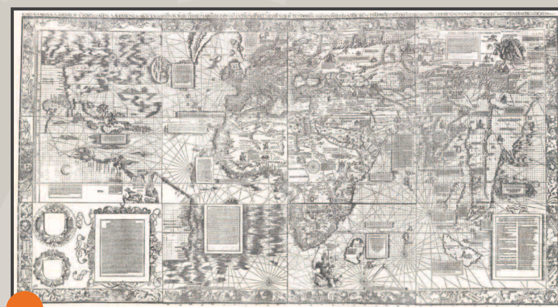
La Carta marina de Martin Waldseemüller (fac-similé de Carlos Sanz, 1961) : l'Amérique du Nord-Est (appelée ici Cuba ), est représentée, en haut à gauche, comme la continuation du continent asiatique, qui jouxte la marge supérieure à droite. / Martin Waldseemüllers Carta marina (Faksimile von Carlos Sanz, 1961): Das oben links abgebildete Nordamerika (hier Cuba genannt) ist als Fortsetzung des an den rechten oberen Bildrand stoßenden asiatischen Kontinents zu denken.

Basel, J. Herwagen, 1555 [Freiburg, UB, J 8030,b]